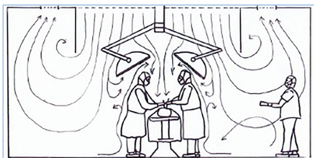
Abb. 2: Fast unwirksame Verdrängungsbelüftung infolge übergroßer OP-Leuchten und Sekundärluftfassungen nahe des TAV-Feldes in der Decke.