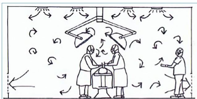
Abb. 3: Mischbelüftung mit überall gleicher Luftqualität

menten-, Implantat- und Probeteiletischen ist eine ausreichende Größe des Deckenfelds entscheidend, weil sich bei kleiner Abmessung der Schutzbereich vermindert und der verdünnende Lüftungsstrom reduziert wird (Diab-Elshahawi et al. 2011, Benen et al. 2013, Fischer et al. 2015).